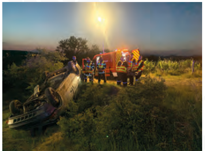
Sur le Chemin de la Serre, une manœuvre a eu lieu fin mai sur une simulation d'accident.