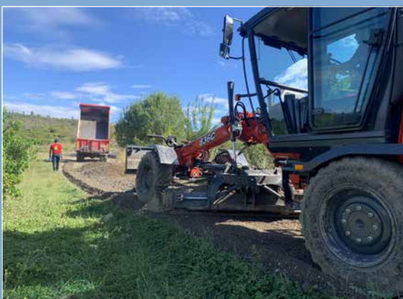
Devenu impraticable le Chemin reliant le pont submersible au Chemin de la Serre a été refait, une partie en enrobé et une partie en grave stérile après un travail préalable en amont pour gérer l'eau pluviale qui le détériorait.