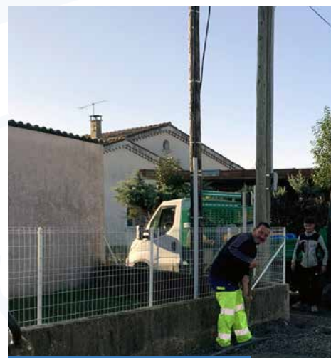
Quartier Les Plagnes