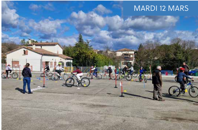
MARDI 12 MARS

Les élèves de CM1, CM2 et CE2 ont participé à une séance de prévention routière par la MAIF (maniabilité, maîtrise du vélo, sécurité). Chaque classe a bénéficié de 2h 30 d'intervention.