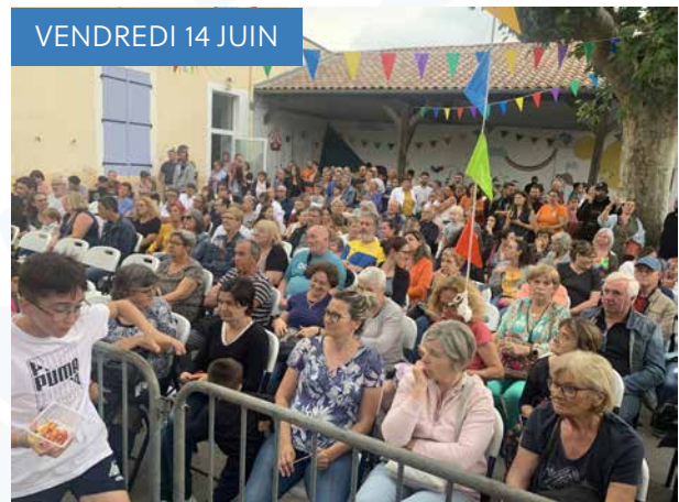
VENDREDI 14 JUIN

Lors du dernier exercice incendie de l'année scolaire à l'école élémentaire, le temps d'évacuation a été de 1 minute 39 secondes y compris le comptage des enfants au fond de la cour de récréation. Depuis la rentrée d'autres exercices ont eu lieu (incendie, confinement, attentats, intrusion).