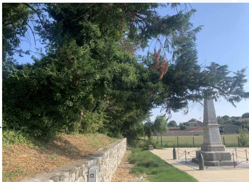
Les cyprès qui menaçaient de tomber sur l'espace de cérémonie ont été abattus.