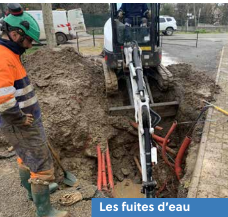
Les fuites d'eau