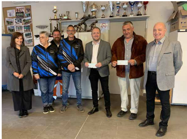
Remise de chèques.