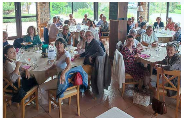
Gym pour tous

Vendredi 31 mai, la « Gym pour tous » a fait son repas de fin de saison au Mas de mon père. Depuis, elle a repris ses cours au deuxième étage de la salle polyvalente durant le temps que dureront les travaux d'agrandissement de la salle des Associations.