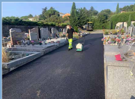
Chaque année, selon leur état, une ou deux allées du cimetière reçoivent un revêtement en enrobé.