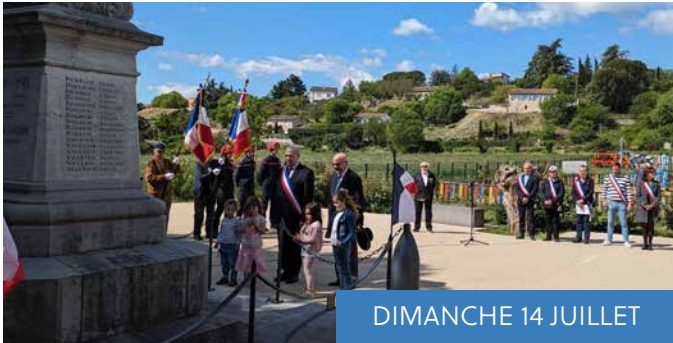
DIMANCHE 14 JUILLET

Dans le cadre de la mise en place du PLUI (Plan Local d'Urbanisme Intercommunal) une réunion publique a eu lieu à la Salle des associations pour la présentation du PADD (Projet d'Aménagement et de Développement Durables).