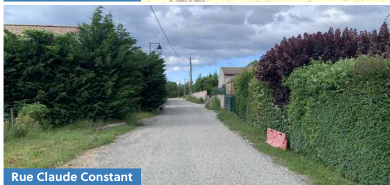
Rue Claude Constant