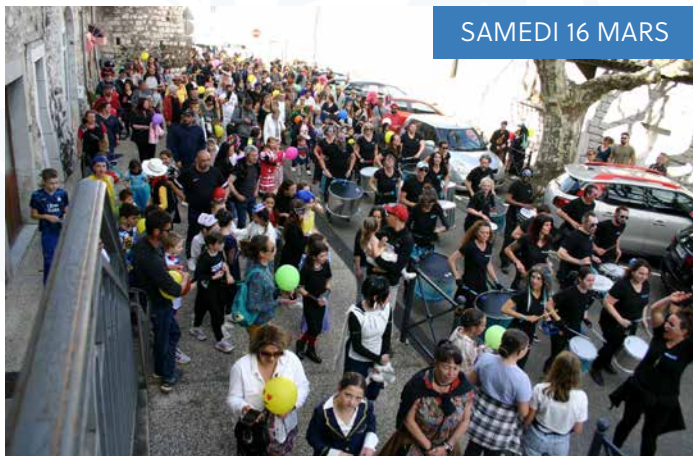
SAMEDI 16 MARS

L'handballeuse internationale sacrée Championne du Monde 2017 et Championne Olympique 2021, Amandine Leynaud, a passé sa journée (temps d'échange ; présentation de ses médailles d'or, du maillot de l'équipe de France et de sa Légion d'honneur ; autographes ; séance d'entraînement d'une demi-heure par classe ; petit match et goûter) à l'école élémentaire qui faisait partie des trois écoles retenues pour cette journée dans le cadre de la promotion des Jeux Olympiques demandée aux athlètes de haut niveau.