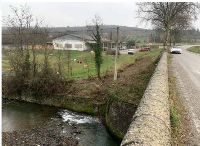
Un gros travail de débroussaillage a été effectué par les employés sur le talus en face de la caserne et sur les culées du Pont d'Auzon afin de les préserver.