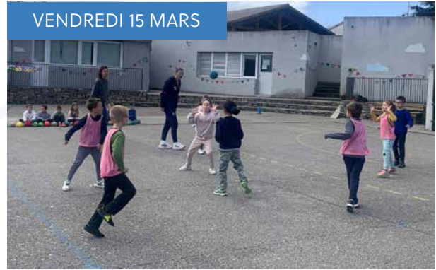
VENDREDI 15 MARS

Les élèves de CM1, CM2 et CE2 ont participé à une séance de prévention routière par la MAIF (maniabilité, maîtrise du vélo, sécurité). Chaque classe a bénéficié de 2h 30 d'intervention.