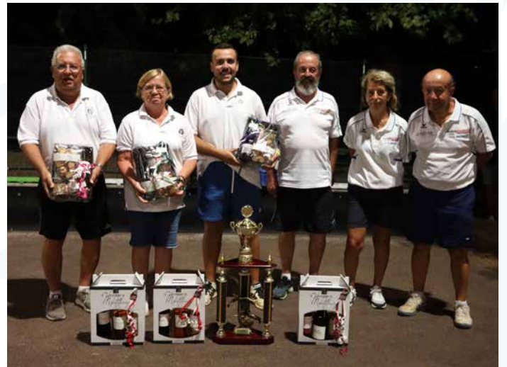
Les finalistes du Challenge Alain Delichiere.