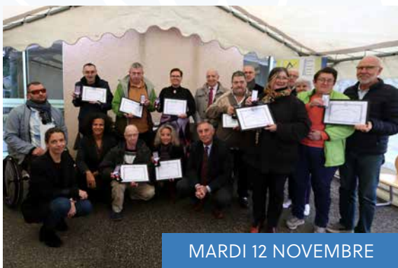
MARDI 12 NOVEMBRE