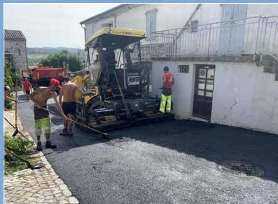
Baptisée « Etoile du Barry » le croisement entre Le Barry, la Rue Toutes Aures, la Montée des Remparts, le Chemin de Mapias, l'Ancienne Voie Royale et le Chemin du Puits du Clôts a été tout repris en enrobé après la fin des travaux pour le passage de la fibre.