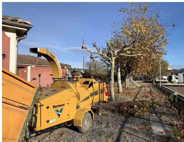
Elagage de tous les platanes situés autour du boulo-drome.