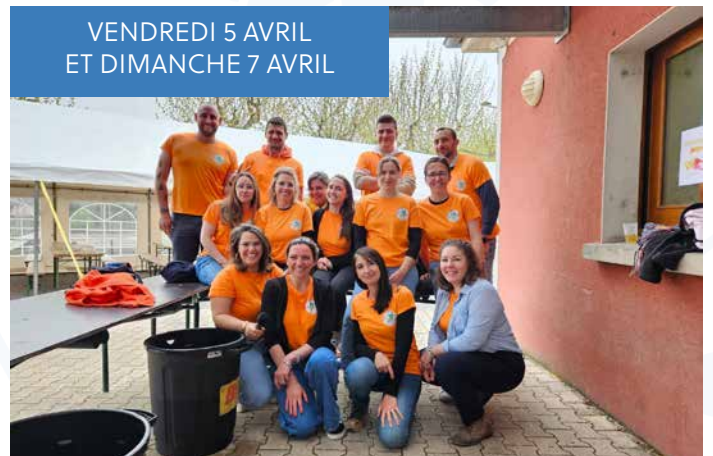
VENDREDI 5 AVRIL ET DIMANCHE 7 AVRIL

Le carnaval des écoles proposé par l'Amicale Laique sur le thème « Lavilledieu en scène, explosion d'émotions » a connu son succès habituel. Rythmé musicalement par la batucada Bahiavi le défilé du carnaval a envahi les rues du village.