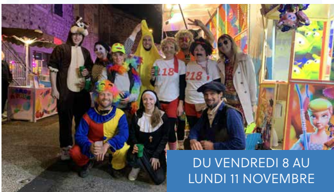
DU VENDREDI 8 AU LUNDI 11 NOVEMBRE

Nombreux sont les seniors villadéens qui sont venus au cloître Saint Martin passer une belle après-midi offerte et organisée par le CCAS (Centre Communal d'Action Sociale) avec concert de chanson française et goûter.