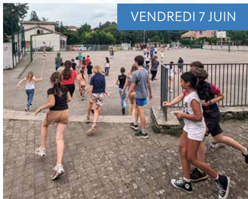
VENDREDI 7 JUIN

Les bénévoles de l'Amicale Laique ont parfaitement réussi l'organisation de leur concours de belote et de leur loto.