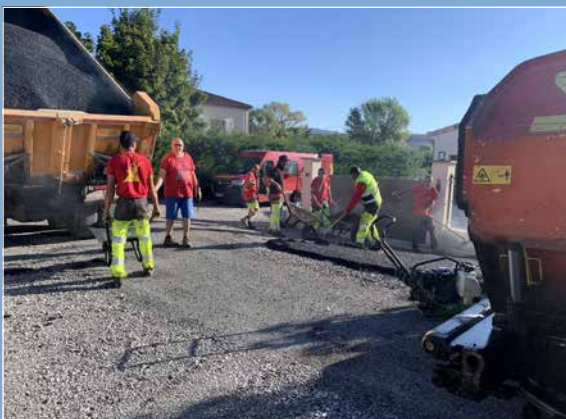
L'Impasse des Châles a reçu son premier revêtement goudronné avec un bel enrobé après la réfection du réseau d'eau pluviale.