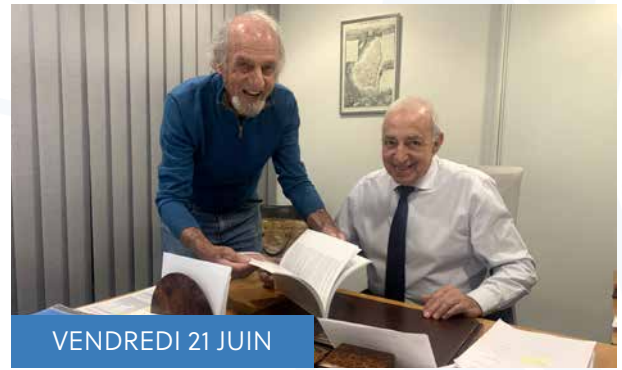
VENDREDI 21 JUIN

La fête votive a été une réussite grâce aux trois associations qui en ont chacune pris en charge une partie avec le soutien technique de la commune : le BMX Riders pour l'organisation générale et les bals, l'Amicale Laïque pour une très belle tournée des pognes avec ses membres déguisés. Pour sa part Barry Pétanque a organisé deux concours de pétanque à la Maison des boules avec le succès que l'on peut mesurer par la participation de 85 doublettes le samedi et 44 triplettes le dimanche.