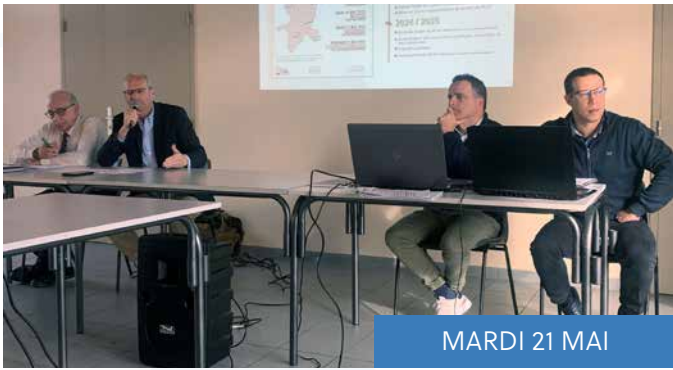
MARDI 21 MAI

Dans le cadre de la mise en place du PLUI (Plan Local d'Urbanisme Intercommunal) une réunion publique a eu lieu à la Salle des associations pour la présentation du PADD (Projet d'Aménagement et de Développement Durables).