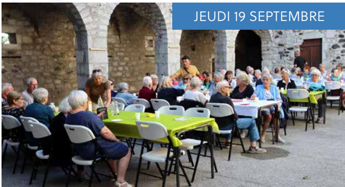
JEUDI 19 SEPTEMBRE

A l'occasion de la Fête nationale, une cérémonie a eu lieu au monument aux morts.