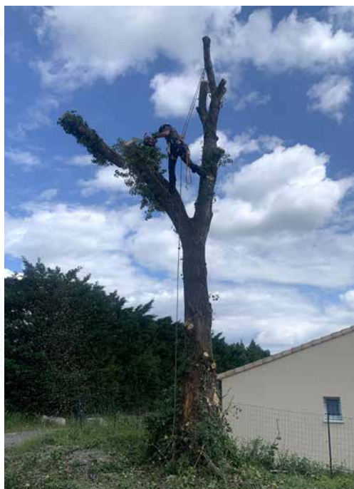
Abattage d'un peuplier qui risquait de tomber dans une propriété privée.